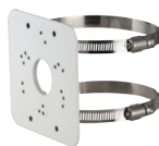
PFA152-E Montaje en Poste