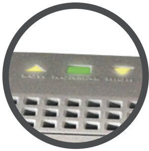
LEDs bajo/alto voltaje y operación normal.

Esta línea de reguladores de voltaje, corrige altas y bajas tensiones de fluido eléctrico, que causan daños a PC's y sus accesorios de CA. El diseño se completa con un supresor de voltaje de alto desempeño que absorbe picos y altos voltajes, componentes incorporados para la filtración de ruidos armónicos que dañan circuitos lógicos de la computadora y su protector de picos y altos voltajes en línea telefónica y DSL para complementar una solución ideal de protección a su inversión de problemas agudos de energía.