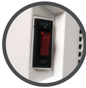
Interruptor de encendido y breaker de sobrecarga.