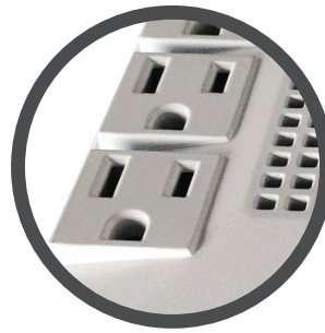
8 Tomas con protección de sobretensión y protección AVR.